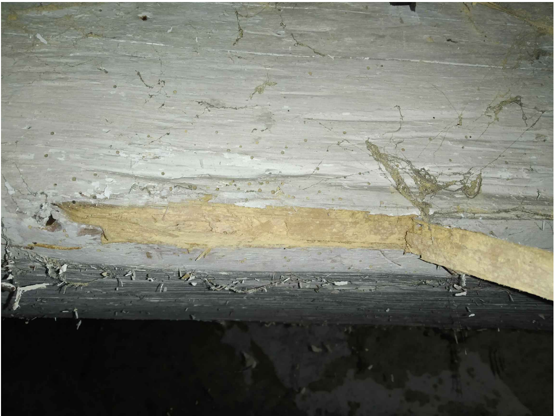
oblast 3 – Poškození dřevokazným hmyzem – viditelné vykoušané cestičky a "piliny"