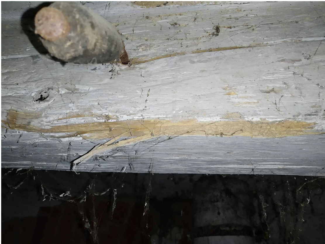
oblast 1 – Poškození dřevokazným hmyzem – viditelné vykoušané cestičky a "piliny"