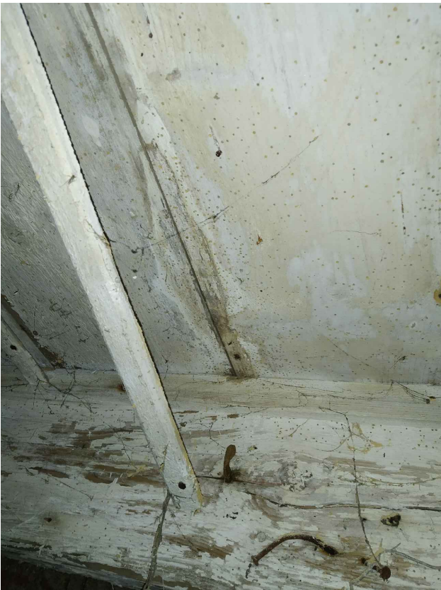
oblast 2 – Poškození dřevokazným hmyzem – viditelné velké množství výletových otvorů