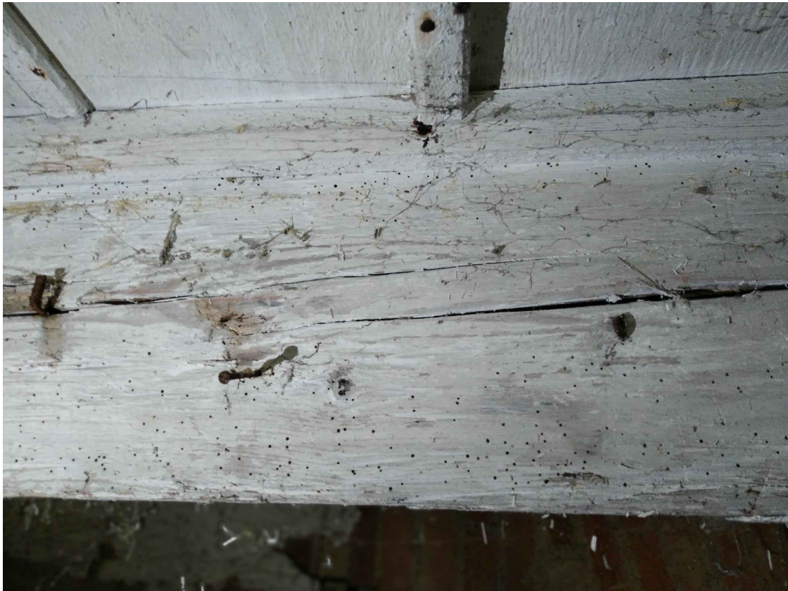
oblast 4 – Poškození dřevokazným hmyzem – viditelné velké množství výletových otvorů